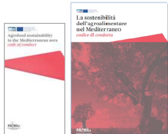
Figure : Code de conduite, brochure et rapport complet

Les deux documents sont disponibles en anglais et en italien.