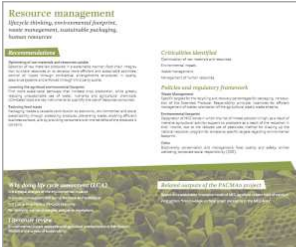
Fig. : Code de conduite : brochure

Le contenu a été classé par thématiques suivantes : chaîne logistique, innovation, gestion des ressources, commerce et exportation, qualité et consommateurs.